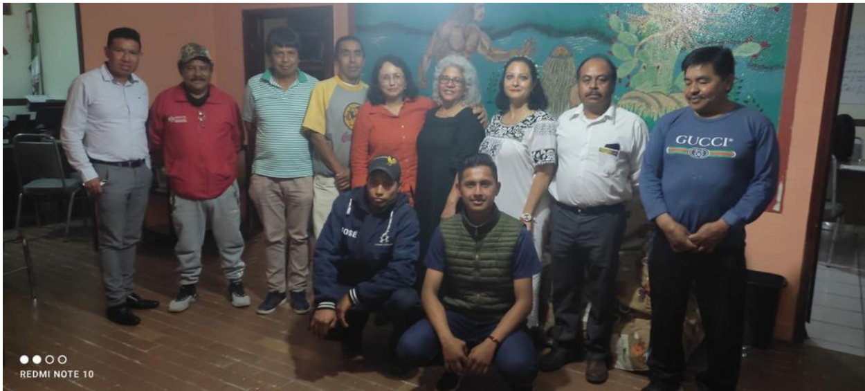
Ilustración 2 Reunión con representantes de las comunidades de Santa Justina Ecatepec y San Felipe Cuauhtenco, para discutir la acción conjunta sobre sus lineamientos comunitarios para ser consultados por autoridades del Instituto Tlaxcalteca de Elecciones. Mayo 2022.

No se permitirá la presencia de ninguna persona externa a la comunidad a la asamblea, que se convocará y se realizará según la normativa propia de San Felipe Cuauhtenco.